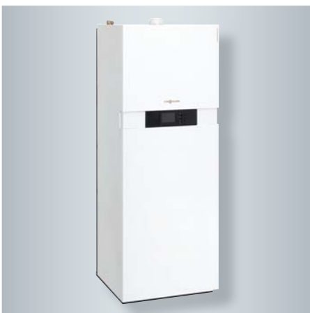
Vitocaldens 222-F Hybrid-Wärmepumpen-Kompaktgerät